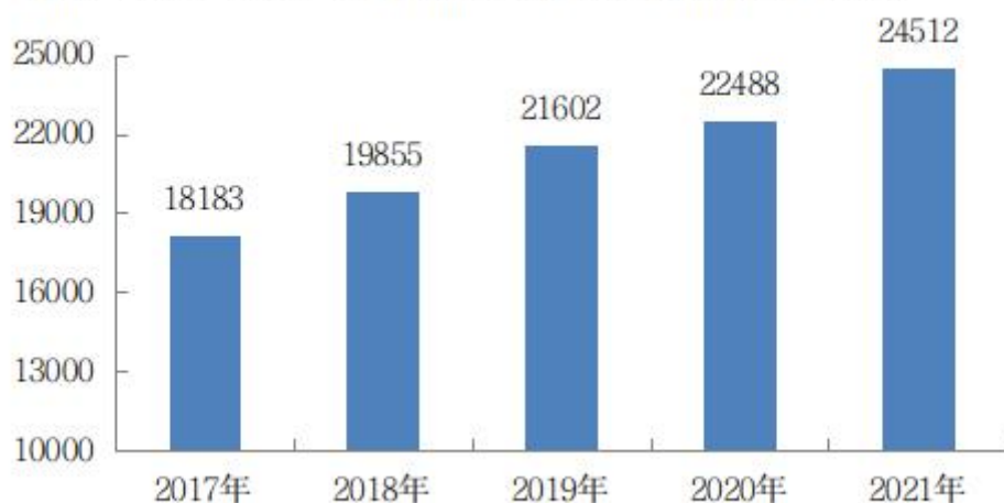
表3 2021年居民人均可支配收入及增速